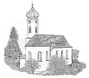
St. Ulrich Wangen