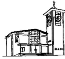
St. Christophorus Percha