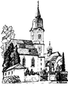
Mariä Himmelfahrt Aufkirchen