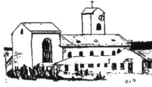
Herz Jesu Höhenrain